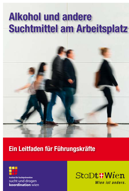
Alkohol und andere Suchtmittel am Arbeitsplatz: Ein Leitfaden für Führungskräfte https://tinyurl.com/alkohol418

Idealerweise gibt es in Betrieben spezifische Betriebsvereinbarungen zum Thema. Beispielsweise sind in diesen Vereinbarungen Stufenpläne, die den Ablauf bei