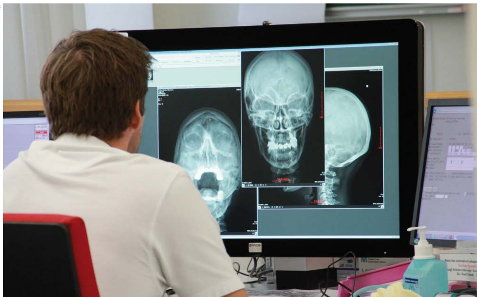
Hauptaufgabe des Lorenz-Böhler-Spitals wird in Zukunft die Nachbehandlung schwerer Verletzungen sein.

Die gebürtige Tschechin hat zwei Kinder mit 19 und 15 Jahren: „Auch als die beiden klein waren, habe ich voll gearbeitet. Das klappte ganz gut, unter anderem weil meine Mama mich sehr unterstützt hat.“ Jetzt macht sie meist vier 10-Stunden-Dienste pro Woche. „Die langen Dienste sind zwar manchmal anstrengend, aber sie haben den Vorteil, dass ich an den anderen Tagen auch tagsüber Zeit habe, um die Kinder zur Schule zu bringen, einkaufen zu gehen etc.“ Im Krankenhaus gibt es zwar keinen Betriebskindergarten, aber dafür Zuschüsse zu Tagesmüttern, Kindergruppen u. Ä. Die Dienste können flexibel eingeteilt wer-