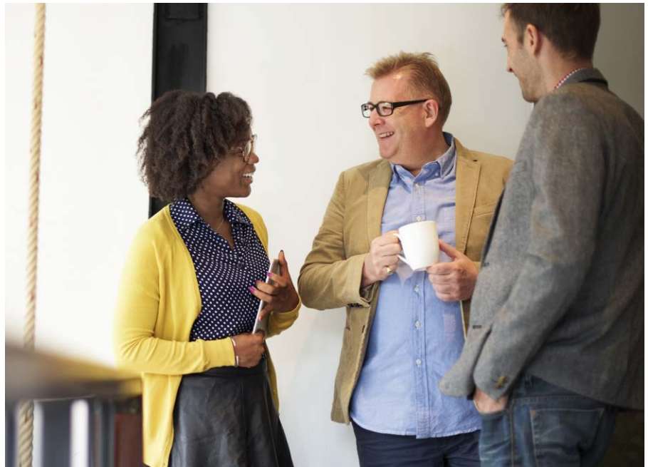
Nutzen Sie Pausen , um sich zu erholen – zum Beispiel bei einem Gespräch mit KollegInnen.