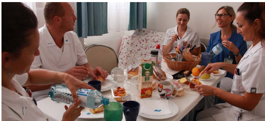
Für die Pausen stehen mehrere kleine, freundlich und funktionell eingerichtete Pausenräume zur Verfügung.