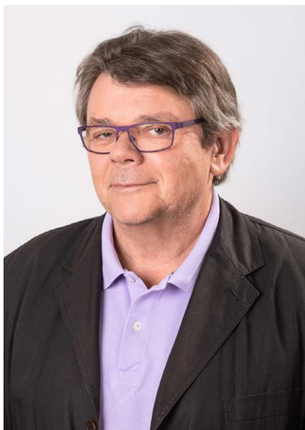
ÖGB-Präsident Wolfgang Katzian: „Wir kämpfen für Verbesserungen.“

„Wir kämpfen Branche für Branche für Verbesserungen im Sinne der Arbeitnehmerinnen und Arbeitnehmer“, so ÖGB-Präsident Wolfgang Katzian. „Wir wollen gute Arbeit und ein gutes Leben für alle ArbeitnehmerInnen.“