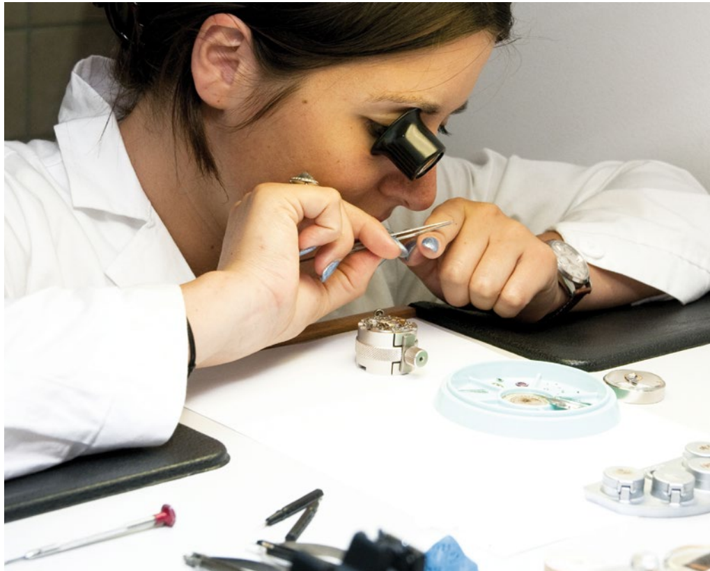
Die Arbeitswissenschaft liefert Antworten zu gesundem und wirtschaftlichem Arbeiten.

Anstatt die Möglichkeiten und Lösungen zu nutzen, die aufgrund arbeitswissenschaftlicher Erkenntnisse vorliegen, verzichten viele Betriebe darauf. Die Folgen sind unorganisiertes und unstrukturiertes Arbeiten mit krank machenden Arbeitsbedingungen. Dadurch verlieren Betriebe viel Geld! Auch wenn kranke Beschäftigte an das Gesundheitssystem „übergeben“ werden, der Verlust von Know-how und die Suche nach geeigneten ArbeitnehmerInnen verschlingen Ressourcen. Ein weiterer Aspekt der Arbeitsgestaltung muss als