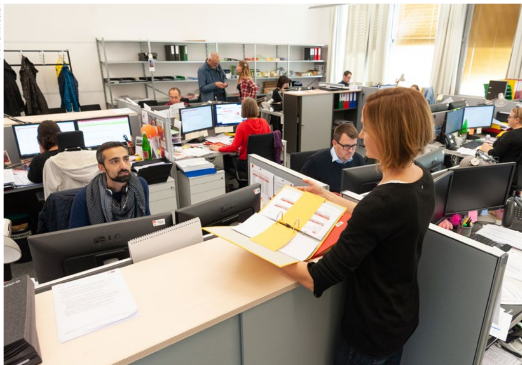
Die Vorbereitungen für die AK Wahlen 2019 sind schon in vollem Gang. Auch im Wiener AK Wahlbüro arbeiten die Kolleginnen und Kollegen auf Hochtouren.

Vor uns steht die wichtigste AK Wahl seit Langem. Die politische Lage bleibt unsicher: Die Bundesregierung drängt die ArbeitnehmerInnen-Vertretungen in Institutionen wie Sozialversicherung, Nationalbank oder Insolvenzentgeltsicherungsfonds zurück. Auch eine Senkung des AK Beitrags steht weiterhin im Raum. Eine solche würde, wie wir wissen, unseren Mitgliedern nur wenige Euro ersparen, sie aber ungleich mehr an wertvollen AK Leistungen kosten. Unsere Mitglieder sind mit dem Beitrag sehr zufrieden, wie verschiedene Umfragen zeigen. Dennoch spre-