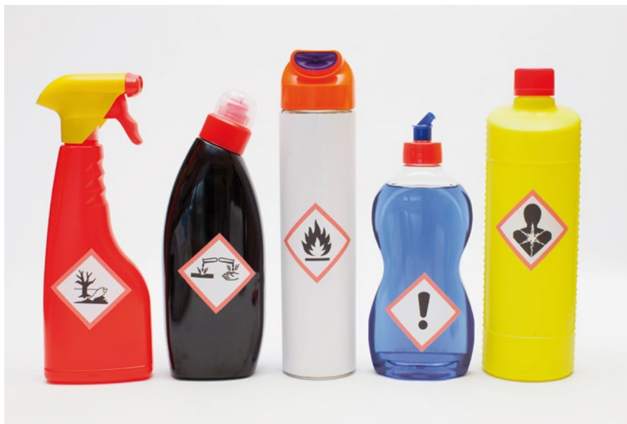
Reinigungsmittel können gesundheitsschädliche Inhaltsstoffe enthalten.

Beispiele wie diese gibt es viele. Chemikalien können auf unterschiedlichste Weise wirken und haben zahlreiche erwünschte und unerwünschte Eigenschaften. Deshalb müssen ArbeitgeberInnen Arbeitsstoffe evaluieren (§ 41 ArbeitnehmerInnenschutzgesetz). Dazu müssen Risiken, die von den Arbeitsstoffen und ihrer Verwendung ausgehen, ermittelt und bewertet werden. Wenn notwendig, müssen geeignete Schutzmaßnahmen festgelegt und umgesetzt werden.