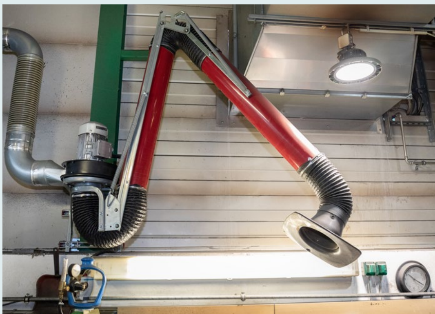
Bewegliche Absauggrüssel saugen den Schweißrauch ab.

Schulungsbedarf? „Viele Menschen mit Behinderungen möchten an einem Produktionsprozess mitarbeiten“, so Dietmar Hammer. „Die entsprechende Ausbildung haben sie aber meist nicht. Dafür wurde 1992 eine eigene Schule gegründet, welche schließlich seit 2010 als Akademie geführt wird. Hier werden Lehrlinge ausgebildet, es gibt aber auch maßgeschneiderte Schulungsmöglichkeiten