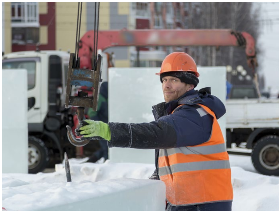
Kältearbeit braucht hochwertige Kälteschutzausrüstung.

Die tiefen Temperaturen des Winters stellen eine Belastung für alle ArbeitnehmerInnen dar, die im Freien arbeiten. Extreme Kälte und schwankende Temperaturen stellen auch hohe Anforderungen an die Schutzbekleidung.