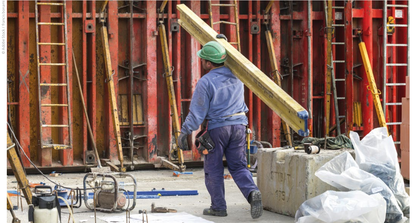
Das Heben und Tragen schwerer Lasten kann zu Muskel- und Skeletterkrankungen führen.

Lungenerkrankungen. An dritter Stelle stehen die Hauterkrankungen. Betroffene werden durch die AUVA entschädigt, das bedeutet, sie haben Anspruch auf Umschulungen, Ausbildungen, Rentenzahlung etc.