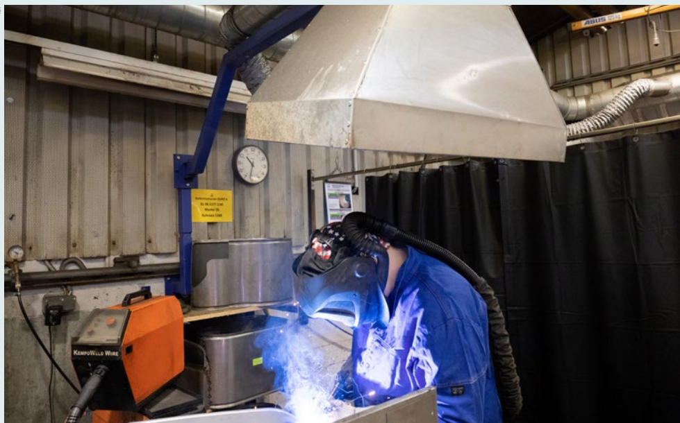
Schweißer bei Team Styria profitieren von der Absauganlage mit Absaugschläuchen und umluftunabhängigen Schweißhelmen.

Zwischen all den funkensprühenden Schweißgeräten, Absaugrüsseln und großen Werkstücken bemerkt man erst auf