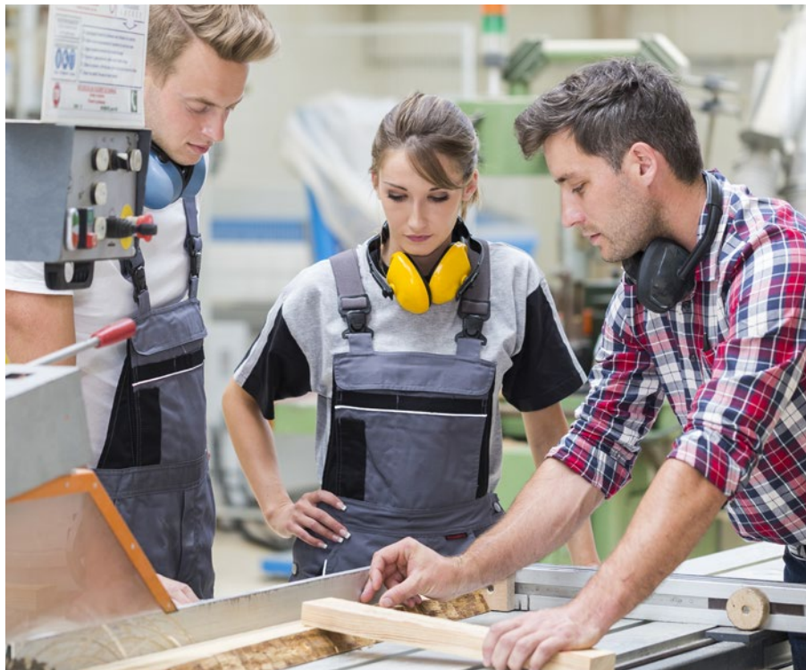
Jugendliche unterschätzen oftmals die Gefahren am Arbeitsplatz.

Damit Informationen verstanden werden, müssen diese verständlich sein und an den Wissensstand sowie an die medien-spezifischen Gewohnheiten der Zielgruppe angepasst werden. Für Sicherheit und Gesundheit gibt es hier beispielsweise die Trickfilmserie rund um Napo. Er ist