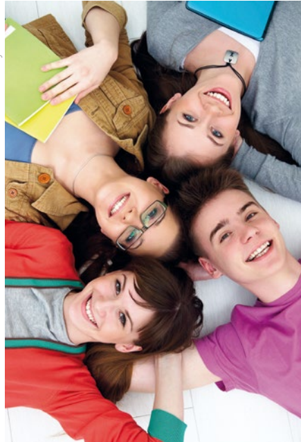
In der AK Tirol gibt es viele Angebote für Junge, z. B. Gratis-Nachhilfe für Lehrlinge oder Auslandspraktika im Rahmen des Projekts „Tirolerinnen und Tiroler auf der Walz“.

Deshalb unterstützt die AK Tirol Lehrlinge mit Gutscheinen für kostenlose Nachhilfe in Mathematik, Englisch und Angewandter Wirtschaftslehre. Jeder Lehrling kann acht Gutscheine für Nachhilfe-Einheiten zu je 90 Minuten anfordern. Sie gelten für die gesamte Lehrzeit bei der Schülerhilfe in Innsbruck, Hall, Schwaz, Wörgl, Telfs, St. Johann und Kufstein, beim Lernquadrat in Imst und der Nachhilfe Außerfern in Reutte. „Wir wollen den jungen Menschen dabei helfen, die Berufsschule und damit die Lehre positiv abzuschließen. Denn neben der Praxis im Betrieb auch noch die Schulbank zu drücken und zu lernen, ist nicht immer so leicht. Oft reicht ein bisschen professionelle Un-